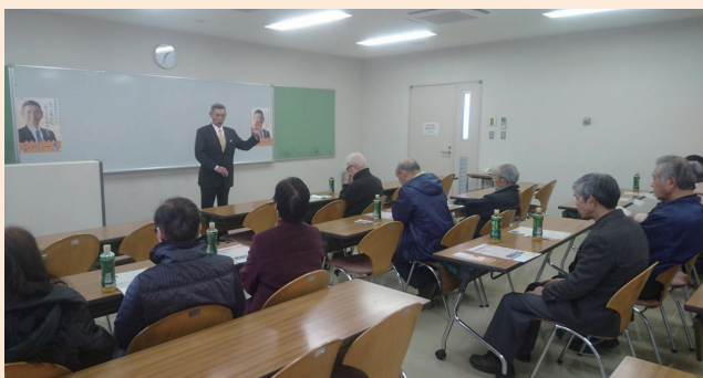
「山武市の未来を語る会」にて

山武市が活性化するために必要な道路橋梁・歩道などの整備につきましては国・県などと密に連携をとりながら迅速に進めてまいります。また市の予算を効率よく振分け、医療体制の充実や子育て支援・基幹産業育成や雇用対策などに取り組んでまいります。