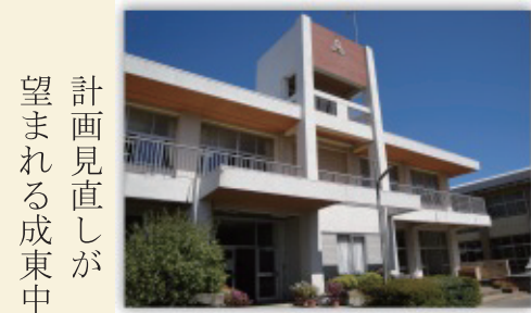
計 画 見 直 し が 望 ま れ る 成 東 中